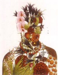
10 アルテンボルト風アquareチント/1998/エッチ ング、アquareチント、メゾチント/530×400/50部/ 1998年 第1回神戸版画ビエンナーレ展出品、1999年 第1回山本鼎版画大賞展出品