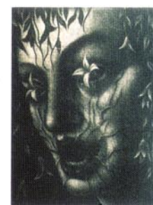
8 from Van Eyck/1996/メゾチント/95×70/50部