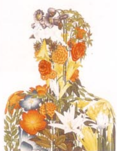
11 アルテンボルト風アquareチント11/1998/エッチ ング、アquareチント、メゾチント/530×400/50部/ 1998年 第1回神戸版画ビエンナーレ展出品、1999年 第1回山本鼎版画大賞展出品

制作の持続から新しい作品は生まれるが、 過去の体験や、現在の心理状況が元になっ ている。悪戦苦闘しイメージをコラージュ させて下絵が完成したら、製版は孤独で愉 しい〈無〉の時間。心地よくではなく、見 るものをゾクゾクさせるもの。何よりもい かに作り手が高度な自己満足を得られるか が必要だ。