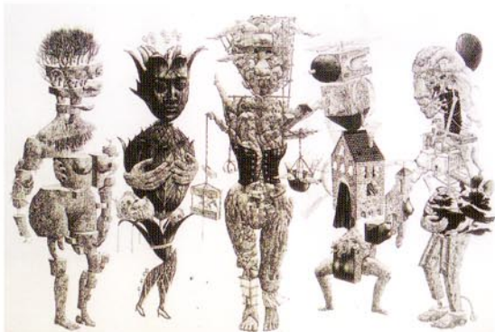
23 5人組/2003/エッチング、アquarell、メゾチント/606×910/50部/2003年 第71回日本版画協会出品