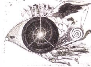
21 鳥/2002/エッチング、アquareチント/150×200 /60部