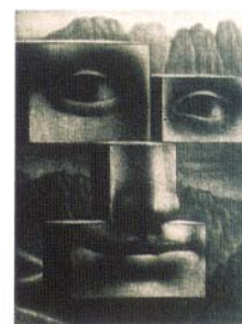
7 from Leonardo/1996/メゾチント/95×70/50部