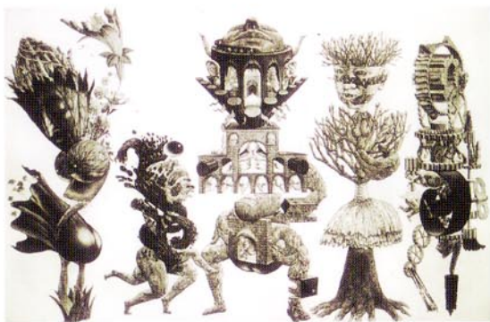
24 家族/2003/エッチング、アquarell、メゾチント/606×910/50部/2003年 第71回日本版画協会出品