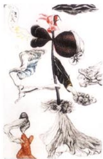
1 環丸とエルンスト/1984/エッチング、アquareチント (2版2色刷り) /235×155/35部

作品リストは下記の分類によって表示しました。 作品番号/作品名/制作年/手法/寸法 (mm) 限定部数/出品歴