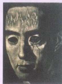
6 Yukio Mishima/1996/メゾチント/95×70/50部