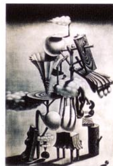
12 人物1/1998/メゾチント/515×352/50部