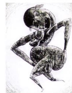
22 ダイエット紙/2002/エッチング、アquareチント/ 200×150/60部