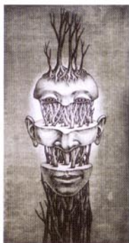
14 集合VII-3/1999/エッチング、アquareチント/ 365×200/50部