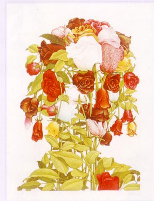
9 Gathering roses