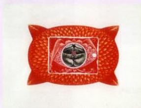
18 Maru no hi/2002/エッチング、凸版刷り、メ ゾチント、レースエンボス/200×150変形/20部