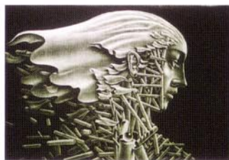
17 顔/2002/メゾチント/290×410/50部/2003年 第48回 CWAJ現代版画展出品