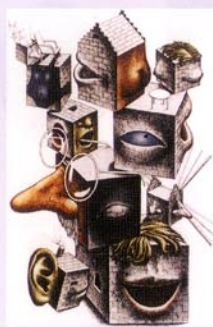
4 社交的人々/1995/エッチング、アquareチント、メ ゾチント (2版多色刷り) /290×195/50部