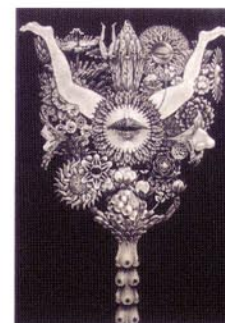
13 集合XXII-2/1999/メゾチント/514×352/50部